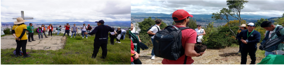
Jornadas de siembra