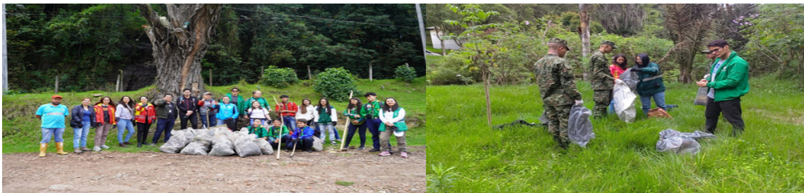
Jornadas de Limpieza

En virtud de esta instancia y en respuesta a las solicitudes de la ciudadanía, durante el año 2024 se llevaron a cabo un total de 119 acciones, que incluyeron actividades como jornadas de limpieza, siembra, caminatas ecológicas, acciones pedagógicas, entre otras. Estas iniciativas contaron con la participación de 11.918 personas, entre las que se incluyen estudiantes de instituciones educativas, miembros de la comunidad en general, y representantes de entidades tanto públicas como privadas.