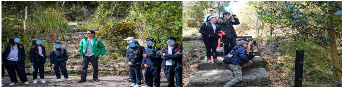
Jornadas pedagógicas y de avistamiento

Finalmente, importante señalar que, a nivel distrital, la instancia principal de participación para abordar temas específicos relacionados con la Reserva Forestal es el Comité de Interlocución de los Cerros Orientales. La Secretaría Técnica de este comité está a cargo de las Secretarías Distritales de Gobierno y Planeación. En este espacio se desarrollan procesos de gestión, asesoramiento, concertación, evaluación y seguimiento para la construcción de los Pactos de Bordo.